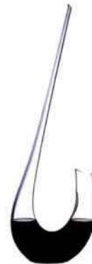
Carafe WineWings. Riedel. 320 €