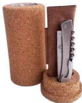
Couteau-sommelier pliant Le St Vincent. Goyon-Chazeau. 242 €