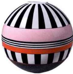
Service de table empilable La Boule. Villeroy & Boch. 299 €