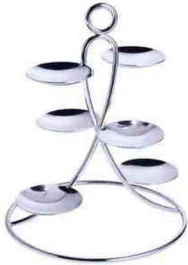
Présentoir Latitude en métal argenté (ø 16 cm x H 20 cm). Ercuis . 265 €