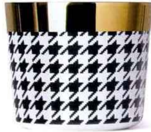
Gobelet à champagne 0,3 l Sip of gold Pepita. Sieger by Fürstengerg. 139 €