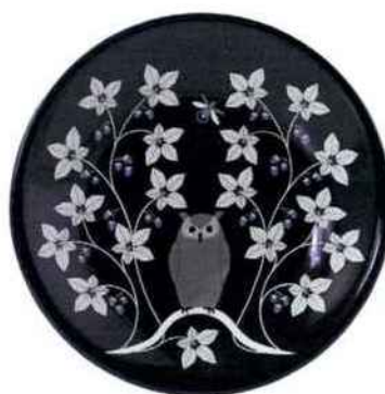
Assiette à dessert ø 22 cm Le Secret. Gien. 116 € le coffret de 4