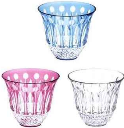
Gobelets Tommy (ø 70 mm x H 60 mm). Saint-Louis. 430 € le coffret de 2 gobelets couleur.