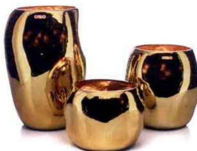
Bougies Gold, collection Cape shine. Onno. De 160 € à 310 € l'unité selon la taille