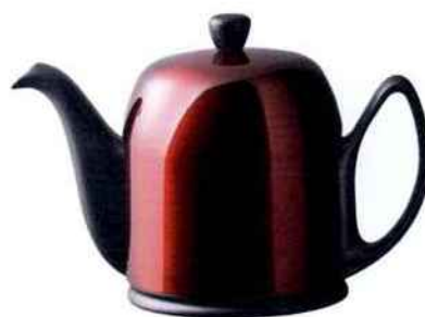
Théière Salam 6 tasses noire cloche pomme d'amour. Degrenne. 119 €