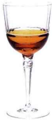
Verre à vin en cristal Alya. Cristallerie de Montbronn. 185,10 € pièce