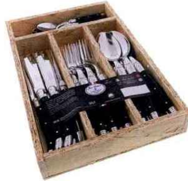
Ménagère 24 pièces Brut (6 couteaux, 6 fourchettes, 6 cuillères et 6 cuillères à café). Jean Dubost Laguiole. 162 €