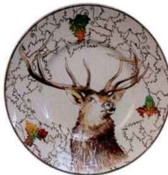
Assiette plate Chambord ø 27,5 cm. Lunéville. 115 € les 4