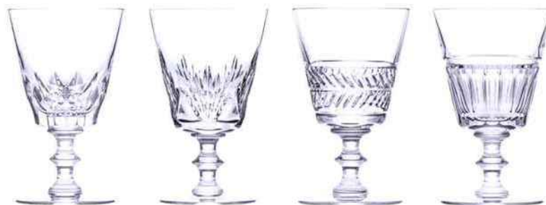
Coffret de 4 verres à pied en cristal Galerie des reines. Saint Louis. 380 €