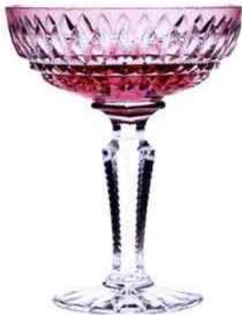
Coupe à champagne (20 cl) en cristal Séville. Cristallerie de Montbronn. 251,50 €