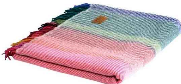
Plaid Ilunabarra en laine mérinos d'Arles (125 x 150 cm). Tissage de Luz. 249 €