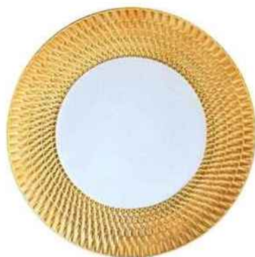
Assiette plate ø 27 cm Twist Gold. Bernardaud. 179 €