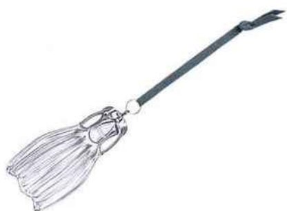
Clochette 2020 (H 174 mm x ø 43 mm). Saint-Louis. 120 €