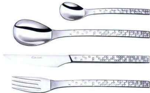
Couverts Pix'elle. Couzon . A partir de 380 € l'écrin 50 pièces