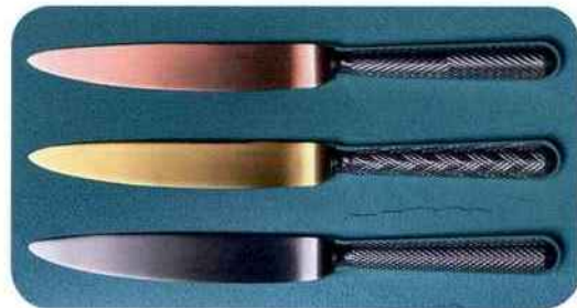
Couverts Miroir. Ercuis. 130 € pièce