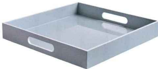
Plateau Signature, existe en formats rond, carré et rectangulaire. Compagnie française de l'Orient et de la Chine. A partir de 115 €