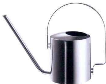
Arrosoir 1,7 l en acier inoxydable Original (33 x 24,5 cm x 13 cm). Design : Peter Holmblad. Stelton. 189,95 €