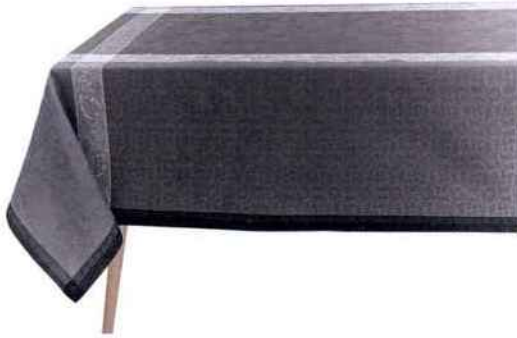
Nappe Ottomane coloris ardoise. Le Jacquard Français. 199 € le format carré 175 cm