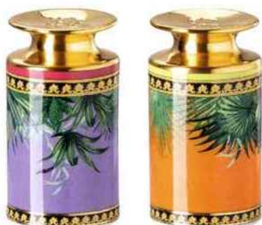
Salière et poivrier Jungle Animalier. Rosenthal meets Versace. 121 € pièce