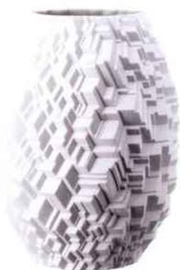
Vase 28 cm Phi, décor city. Design : Cairn Young. Rosenthal. 439 €