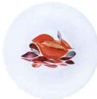
Assiettes à dîner Dame Nature, réalisées en collaboration avec Alain Passard. Maison Fragile. 354 € le coffret de 6