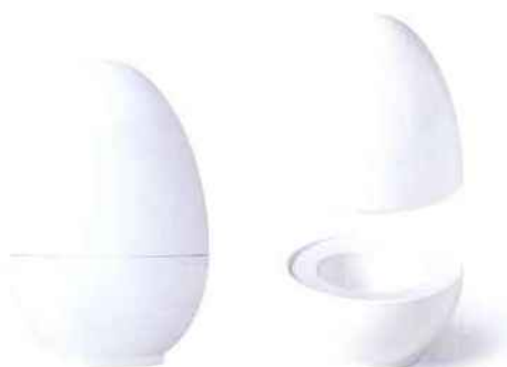
Egg cup Temptation Matroschischka. Sieger by Fürstenberg. 179 €