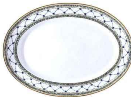
Plat ovale Allée du Roy (L 36 cm x l 26 cm). Raynaud. 283 €