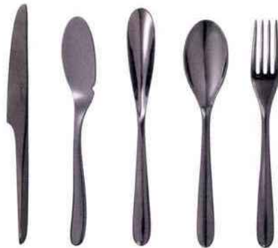
Couverts en acier L'Âme de Christofle. Disponibles en coloris cuivre, or et noir. Design : Eugeni Quitlet. Christofle. 136 € l'ensemble 5 pièces