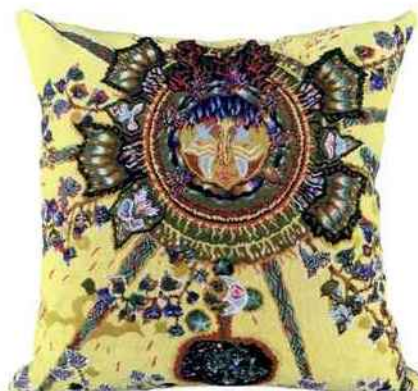
Coussin Jean Lurçat 60 x 60 cm. Jules Pansu. 182 €