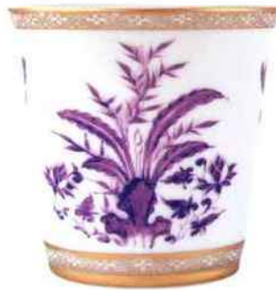
Pot à bougie Prunus. Bernardaud. 120 €