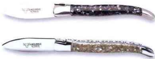
Couteau à huître Laguiole, manche fabriqué à partir de coquilles d'huître ou de moules broyées et coulées dans de la résine. Laguiole en Aubrac . 121 €