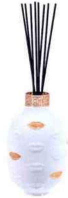
Coffret bouquet Muse (bouquet 8 tiges, 400 ml de parfum thé vert impérial). Design : Jonathan Adler. Maison Berger Paris. 109 €