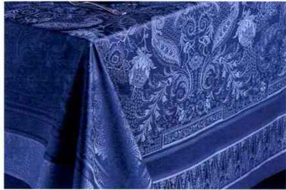
Nappe Persina Crépuscule (174 x 174 cm). Garnier-Thiebaut . 237 €